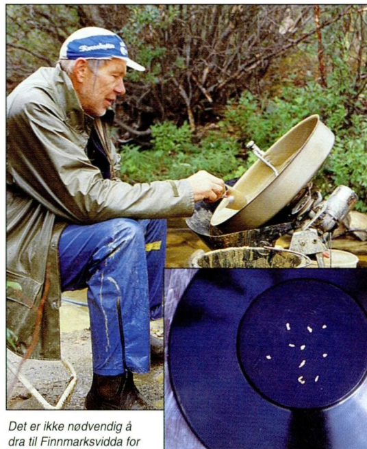
Det er ikke nødvendig å dra til Finnmarksvidda for å vaske gull. Hvis ønsket bare er å finne noen gullkorn, kan bekken i nabolaget gjøre nytten. Men det vil kreve en del graving og mye pannevasking - tålmodighet er en dyd! Disse bildene er fra Sargejok i Finnmark. (Foto: A.K. Dahl, NGU).

Alluviale gullforekomster (placerforekomster) er blitt dannet gjentatte ganger gjennom jordens historie. Den største gullforekomsten i verden er en forsteinet placer eller en paleoplacer som ble dannet i Witwatersrand-området i Sør-Afrika for ca. 2500 millioner år siden.