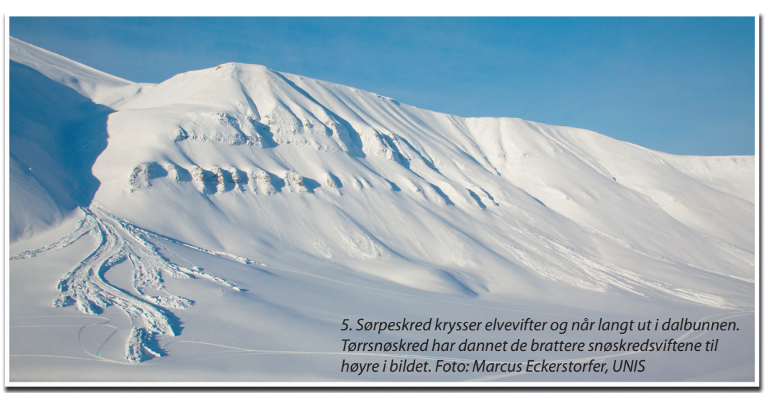
5. Snøskred krysser elvevifter og når langt ut i dalbunnen. Tørrsnøskred har dannet de bratte snøskredsviftene til høyre i bildet.

Ferdsel i landskapet Som nevnt er det flere ulike landformende prosesser som er aktive i kartområdet. Noen av disse kan være farlige for mennesker som ferdes om vinteren, mens noen typer terrengoverflater er lite egnet for å bevege seg over om sommeren.