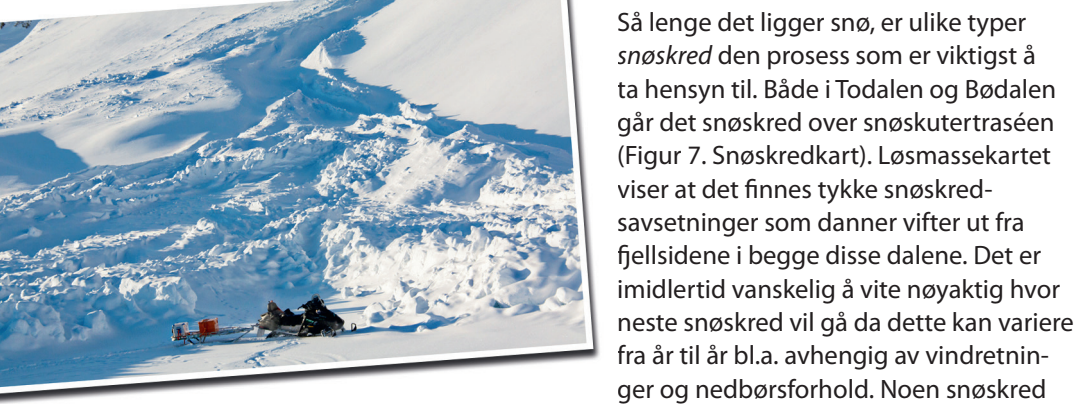
6. Snøskredavsetning. Snøskuteren foran i bildet antyder størrelsen på avsetningen.

Ferdsel i landskapet Som nevnt er det flere ulike landformende prosesser som er aktive i kartområdet. Noen av disse kan være farlige for mennesker som ferdes om vinteren, mens noen typer terrengoverflater er lite egnet for å bevege seg over om sommeren.