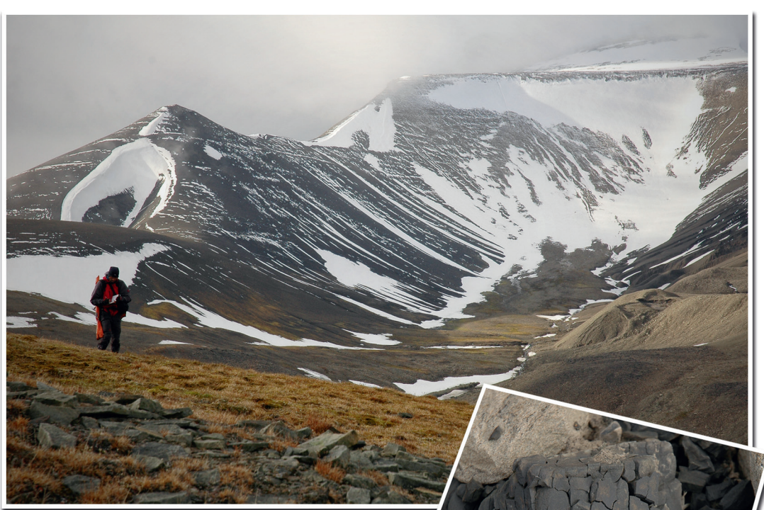
1. Den svarte leirskiferen finnes flere steder, særlig rundt Gangskardet. Den forvitret raskt og gir mye «jevne» skråninger enn sandsteinene i resten av fjellet.