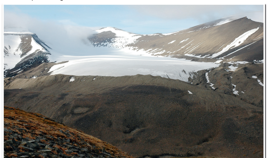
4. Svendsenbreen med tydelige endemorener som trolig ble avsatt under den kalde perioden som kalles «lille istid», og som på Svalbard tok slutt for ca. hundre år siden.

Snøfonner finnes mange steder i Todalen, Gang- og Bødalen. Snøen samler seg i områder med le, og fjølene blir ofte liggende mot nord i skyggefulle områder. Skråningene foran snøfonnene preges av smeltevann som renner fra snøen gjennom sommeressongen. På disse skråningene dannes det stein-plattinger der alt finstoffet er ført bort. Over tid kan snøfonner grave bakover og inn i skråningene (kalt nivasjon ), og lav og planter har her en annen sammensetning enn ellers på skråningene.