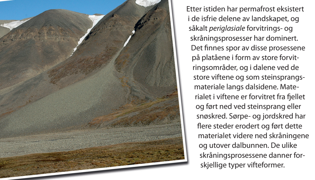
3. Frostforvitring produserer mye materiale som transporteres av snøskred og blir avsatt på store talusvifter i dalsidene.

De overordnede landskapsformene er dalene. Før de store istidene for ca. 2.5 millioner år siden, var elve-erosjon den viktigste prosessen for dannelsen av dalene. Under istidene har isbreer erodert videre i de gamle elvedalene og formet dem til U-formede daler. De mindre V-formede sidedalene som kommer ut i de U-formede dalene er enten yngre enn den siste istiden, eller de lå i en beskyttet posisjon mot den overordnede bre-bevegelsen, på tvers av retningen til den siste isen. Da de siste restene av den store innlandsisen smeltet bort fra Todalenområdet, for vel 10 000 år siden, la den igjen morene- og breelvmateriale. Etter det har mindre botn- og dalbreer lagt igjen morenerygger og breelvsedimenter i dalbunnen.