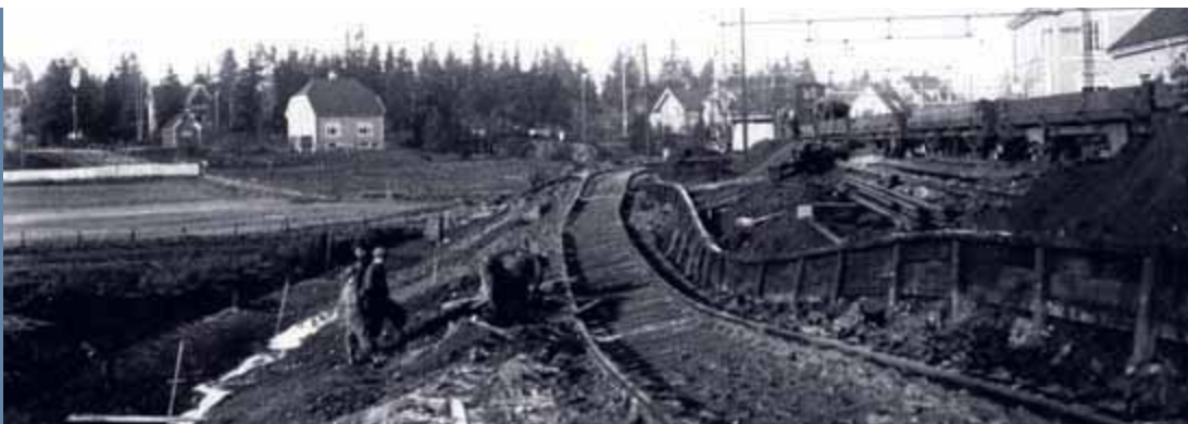
FIGUR 2 Utglidning av skinnegangen ved Kolbotn jernbanestasjon 14. november 1936 på grunn av ustabil leirgrunn.

vannsdatabasen og det landsomfattende grunnvannsnettet, er godt tilrettelagt for vår regionale vannforvaltning.