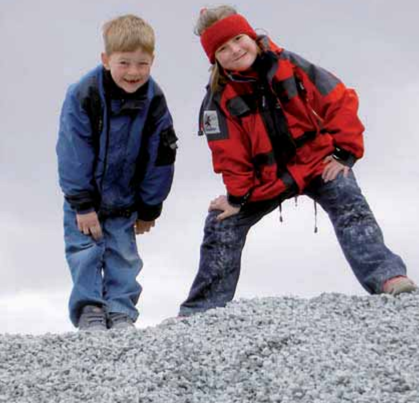
FIGUR 3 Fra Vassfjellet pukkverk, Trondhiem.

Norge ligger langt framme internasjonalt i digital tilrettelegging av geografisk og geologisk informasjon, og mer kart og geodata skal ut til flere brukere. NGU har gjennom satsingen NGU Digital etablert en rekke geologiske databaser og Internett-løsninger. Nå tar vi et nytt steg og leverer en rekke datasett og tjenester til etableringen av www.geonorge.no . Det gjør vi sammen med 18 offentlige, nasjonale partnere og landets fylker og kommuner gjennom den nasjonale geografiske infrastrukturen Norge Digitalt.