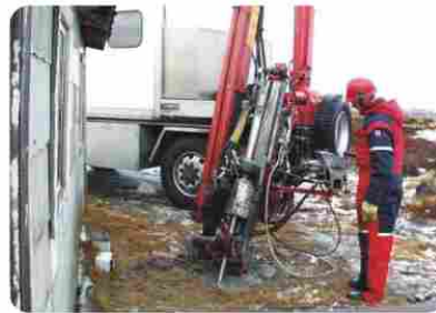
Prøvetaking / sampling