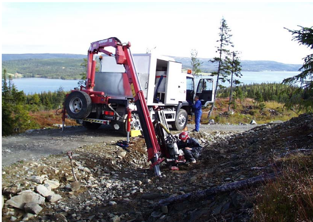
Prøvetaking med LITO-riggen.

Vi samler inn fjellprøver fra hele landet!