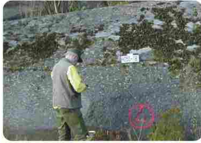
Kartlegging / mapping