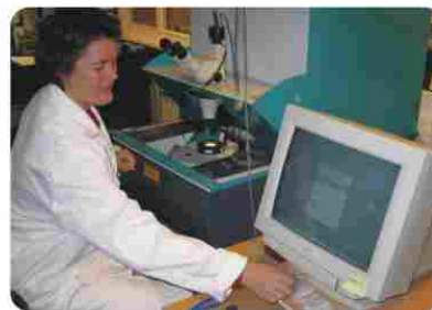
Analyser / analyses