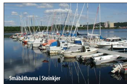
Småbåthavna i Steinkjer

NGU har som en oppfølging foretatt en kartlegging av miljøgifter i jorda på opplagsplasser og pussesteder for småbåter på land i de samme 10 småbåthavnene, i tillegg til Skansen i Trondheim. I de tidligere undersøkelsene er det ikke lagt vekt på forurensningskilder på land. Jorda som er prøvetatt, kan lett spres til sjøen og dermed forurense sedimentene. Det er lett tilgjengelige masser som kan spyles vekk under pussearbeid, renne ut i sjøen under regnvær og forflyttes under snømåking. NGU samlet inn 87 prøver fra 11 småbåthavner i 2004.